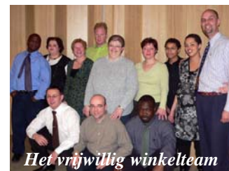
Het vrijwillig winkelteam

Na de BCB beurs in Houten (een beurs waar al de leveranciers van christelijke artikelen hun spullen aanprijzen), hebben we IN GELOOF veel ingekocht om de winkel eens goed vol te krijgen. Dit deden we ook met het oog op de klantenavond. Met kerst hadden we adressen van klanten verzameld, en die hebben we uitgenodigd op onze klantenavond. Zusters uit de gemeente hebben deze avond volledig verzorgd. Zo konden de mensen van de Israel producten wijn en kruiden proeven, hielden we een enquête om inzicht in de 'markt' te krijgen en kregen ze een tas mee met