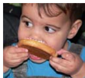
Besluit met muisjes!

enorm dankbaar voor al de bemoedigingen, zegen en gelukswensen van vele mensen. Laatst zijn we al alle 6 naar de kerk gegaan op zondag. Het viel ons op dat juist de mensen uit Montfort zo enorm betrokken en geïnteresseerd zijn. God is echt iets bijzonders aan het voorbereiden in ons dorp.